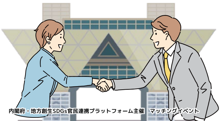
内閣府・地方創生SDGs官民連携プラットフォーム主催 マッチングイベント

また、開催中には自治体職員が直接課題を発信する「1分ピッチ」も実施しております。